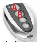
Typ 2 Podkowa

Nowoczesny, mikroprocesorowy, uniwersalny pilot zastępujący do czterech przycisków dowolnego pilota/pilotów z kodem stałym 433.92MHz AM