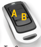
Typ 3 Banan