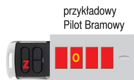
przykładowy Pilot Bramowy