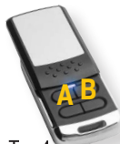
Typ 4 Klapka

Pilot CLONER jest bardzo nowoczesnym pilotem uniwersalnym, który potrafi zarejestrować i odtworzyć (wysłać) sygnał radiowy Pilota Bramowego. Pilot Bramowy musi być pilotem z kodem stałym , nadawać na częstotliwości 433.92MHz AM. Na świecie istnieją setki różnych modeli spełniających te warunki.